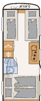
Aero up 530 ER